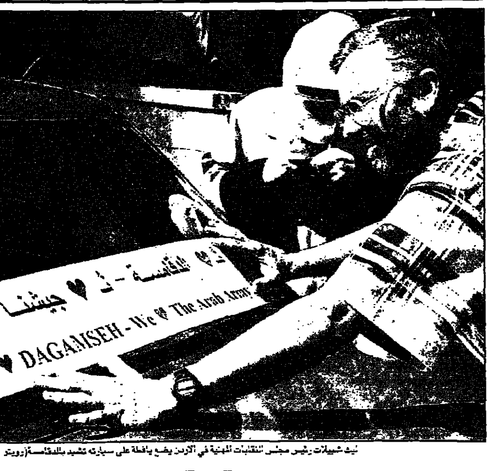
يبدأ عمليات رئيس مجلس أمناء القوات الجوية في الأردن يرفع يداً على سيارته تشيد بالقتال في بيروت

واشنطن - «القدس العربي» وافق مجلس النواب الامريكى على منح مصر 100 مليون دولار لمصر. وقالت صحيفة «واشنطن بوست» عن مسؤول سابق في وكالة المخابرات المركزية قوله ان الوكالة كانت في السنوات الماضية تمنع مسؤوليها في الخارج من مجرد التحدث الى مسؤولي المخابرات المتقاعدين او مساعدتهم في اميائهم بطريقة غير مباشرة.